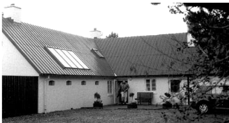
Lille Skiveren, foto Bodil Heister

Den enkelte gæst får et værelse med arbejdsbord og adgang til fælles rum. Derudover er der tre atelierer. Der er ikke indrettet et lydisoleret musikrum. Derfor kan Klitgården kun tage imod musikere og komponister, som bruger instrumenter med høretelefoner. Tre daglige måltider bliver serveret. Yderligere oplysninger om forholdene på Klitgården kan fås ved henvendelse til Lotte Rohde,